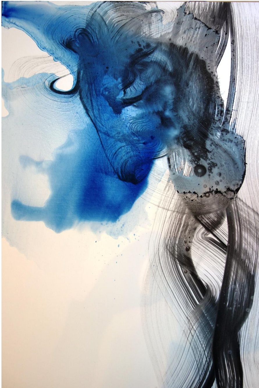
« Licorne » 116 x 81 cm