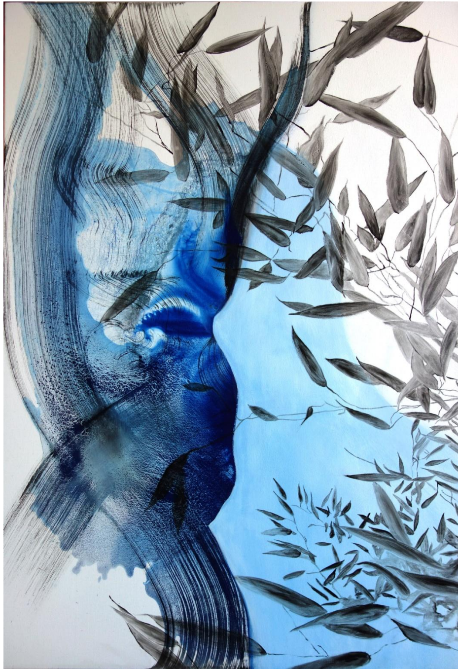
« Aigle » 116 x 81 cm