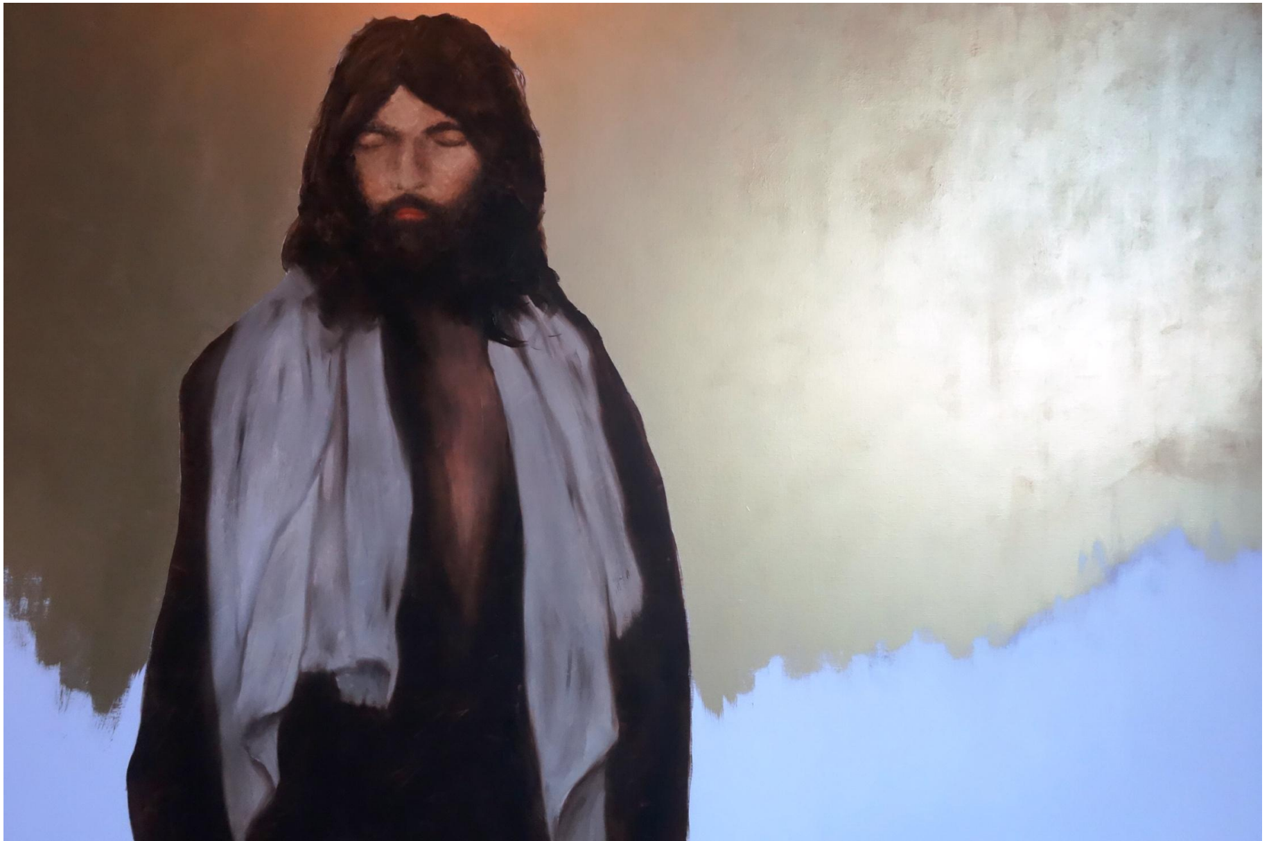
« Notre Père », 81 x 116 cm