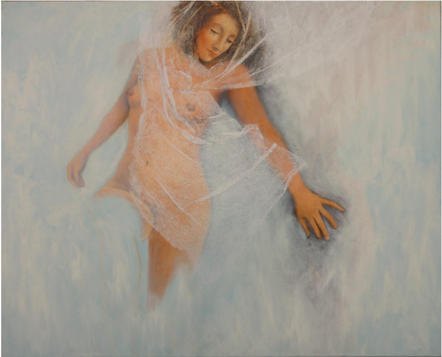
« Marie Madeleine », 80 x 100 cm