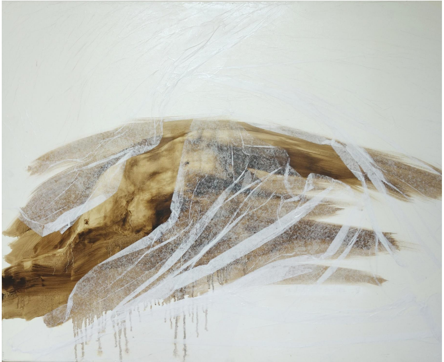
« Descente de croix », 80 x 100 cm